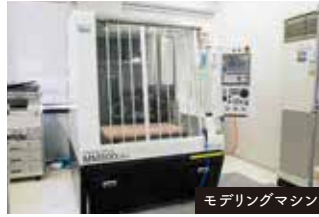
モデリングマシン