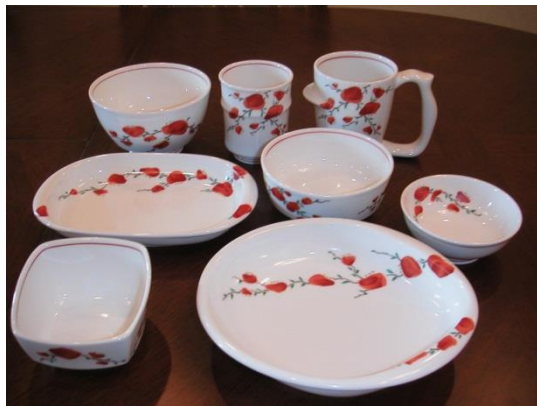
介護・福祉用UD食器