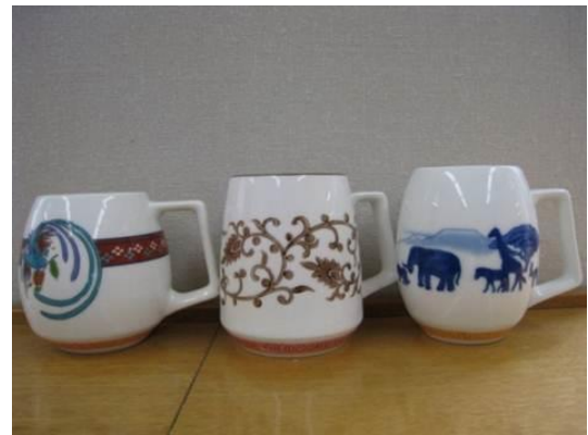
スターバックス企画商品(マグカップ)