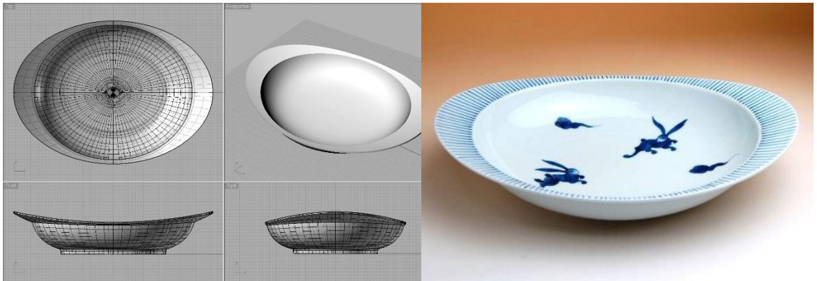
匠の蔵シリーズ「カレー皿」