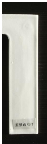
充填不足によるヒケが目立ちます