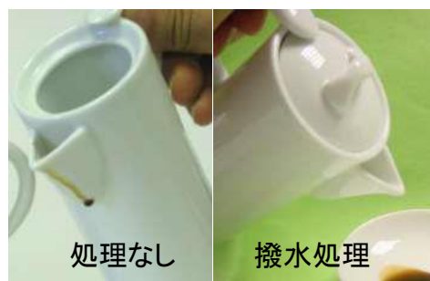
醤油差しの後引き抑制