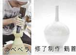
のべペラ 修了制作 鶴首