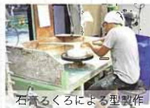
石膏ろくろによる型製作