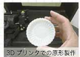
3Dプリンタでの原形製作