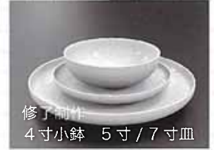
修了制作 4寸小鉢 5寸 / 7寸皿