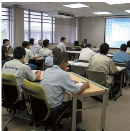
固体酸化物型燃料電池（SOFC）研究会

物型燃料電池（SOFC）と色素増感型太陽電池について知る絶好の機会ですので、興味をお持ちの方は当センターファインセラミックス部までお問い合わせください。