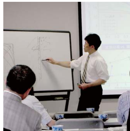
色素増感型太陽電池研究会