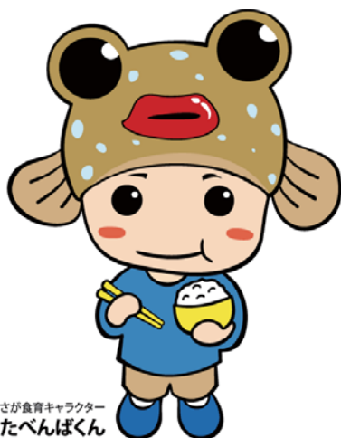
さが食育キャラクター たべんぱくん