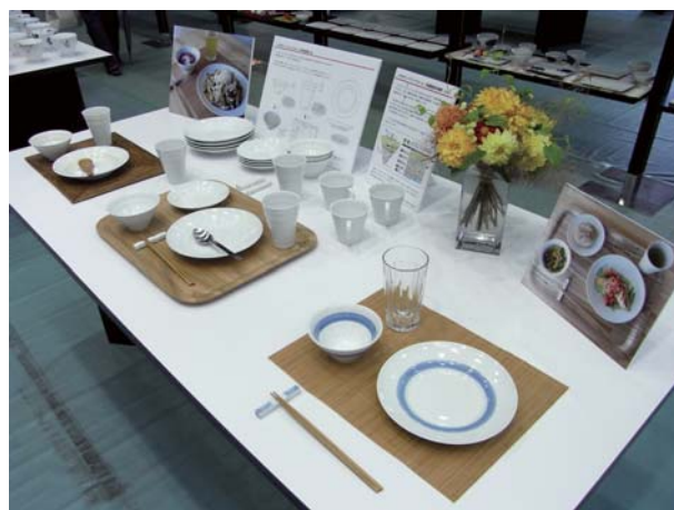
メタボリックシンドローム予防食器のプレゼン