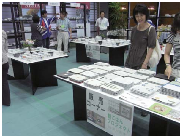
佐賀やきもの展の会場

けます。また、なおかつ食卓の雰囲気や損なわない魅力のある食器製品を目標とし、洋食をメインに想定した食器セットを提案しました。来場者からは、用途やデザインについて好評な意見が得られました。また、日経新聞で報道されるなど社会の注目も高いものがあります。今後は改良などにより完成度を高め、業界への普及を行っていきます。