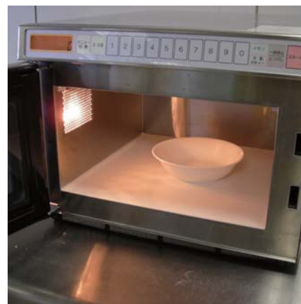
業務用電子レンジでの試験の様子