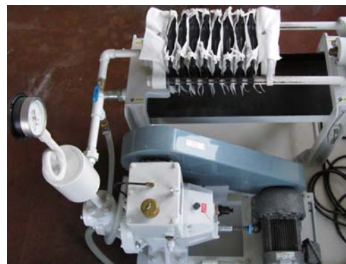
フィルタープレス

ボールミルなどで湿式混合したスラリーの余剰水を、加圧濾過により除去する単式両面濾過機構を持つ手動フィルタープレス装置です。本機はケーキ1枚容量が0.45Lと小さく少量のスラリーから脱水できます。従来のフィルタープレスと比べ少量での陶土調製が可能になりました。